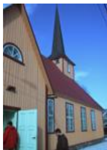
Bilder av kirken i Haapsalu

Siden 2002 har vi hatt vennskapsmenighet i Haapsalu, Estland. Vi har hatt besøk fra dem, og mange fra vår menighet har vært på besøk der. Vennskapsmenigheten er omtrent på samme størrelse som vår. Nå er det endelig tid for en ny tur. Vi besøker våre venner i Estland og er med på gudstjenesten i Haapsalu søndag 24. september.